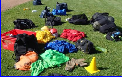
Photo du mois: Reprise des entraînements selon les procédures de la FFF. Infos du club

Le minibus du club : Il reste êtes intéressés pour mettre votre publicité sur notre véhicule veuillez nous contacter via notre page Facebook, via les éducateurs ou dirigeants. Ils nous soutiennent déjà dans notre démarche : Groupama, Ets