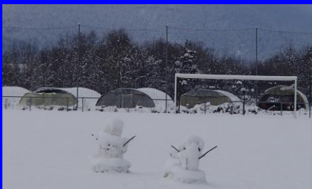
Photo du mois: La neige s'est installée sur les stades. Infos du club